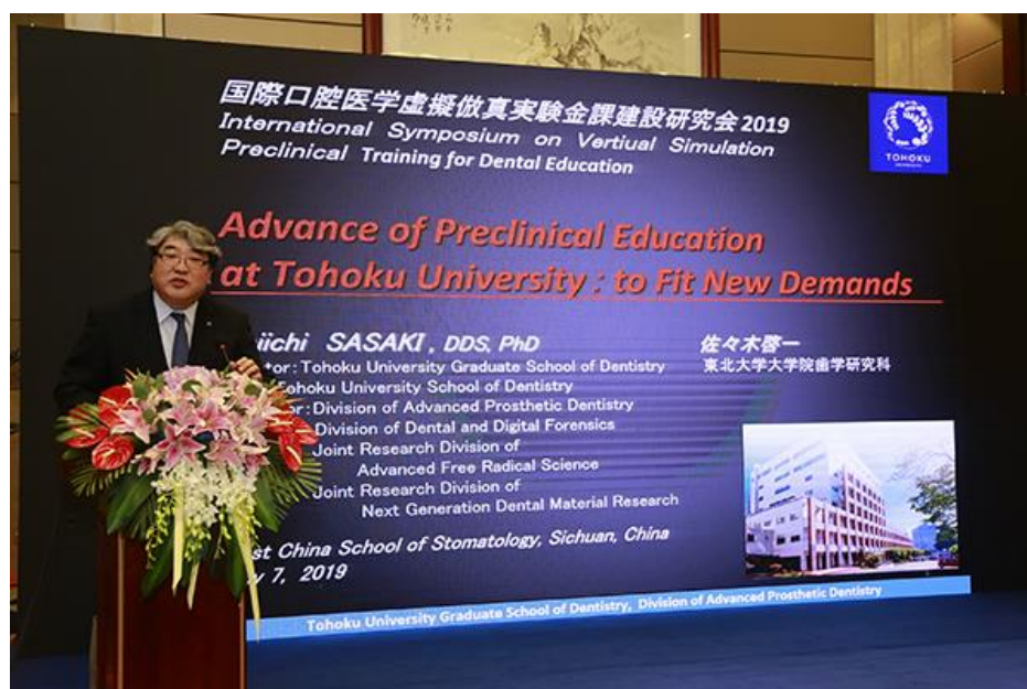
日本东北大学大学院齿学研究所佐佐木教授在会上作专题报告